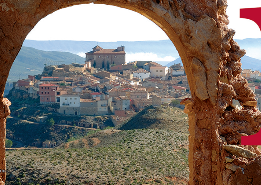
Alacón. Conjunto Urbano